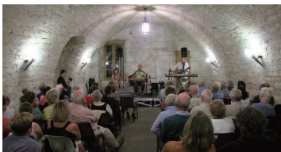
La Britannique Neil Innes avec le duo local Rag Mama Rag au Folk Club de Cahors à Labastide-Marnhac en août 2018.

Le prix d'entrée est de 10 € ; pour chaque soirée, les portes s'ouvrent à 20h pour un démarrage à 20h30.